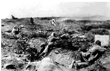
Francouzský útok na německé pozice